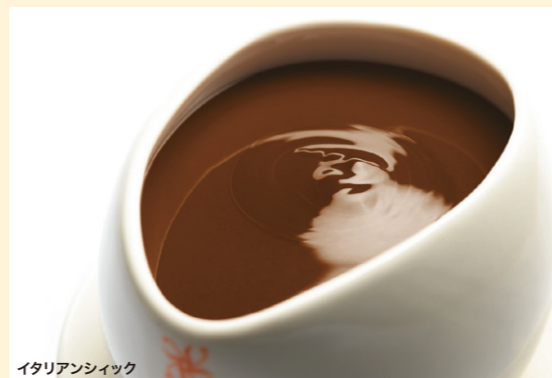
イタリアンシイック