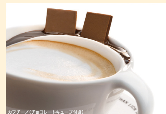
カプチーノ(チョコレートキューブ付き)