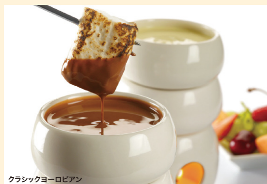
クラシックヨーロピアン