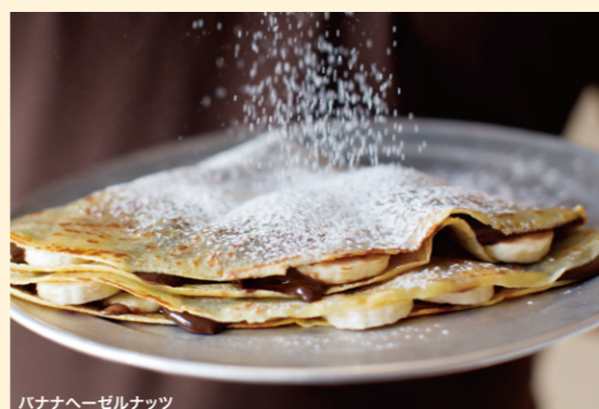
バナナヘーゼルナッツ

バナナ/チョコレート/キャラメルの中からお好きなアイスクリーム2種類とホイップクリームをトッピング