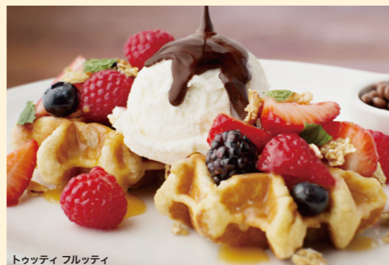
トゥッティ フルッティ