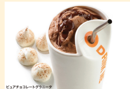
ピュアチョコレートグラニータ

製造工場や店舗では、本来その商品に含まれていない他のアレルギー物質が商品に付着・混入する可能性があります。