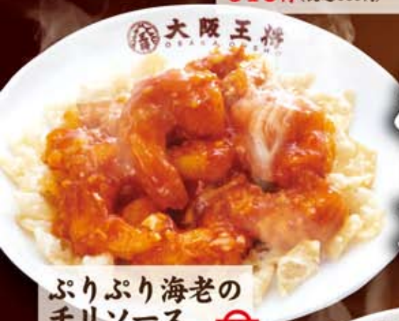
ぷりぷり海老の チリソース 667円(税込720円)