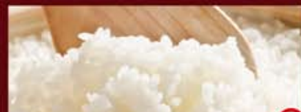
ごはん(小) 176円(税込190円) 130円(税込140円)