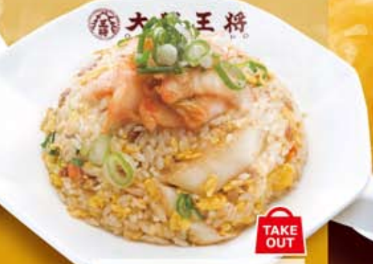
本格キムチ炒飯 TAKE OUT 584円 (税込 630円)