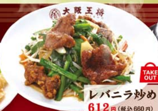
レバニラ炒め 612円(税込660円)