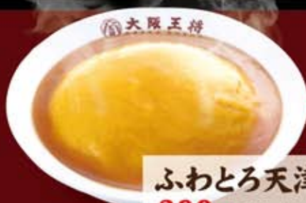
ふわとろ天津飯 399円(税込430円)