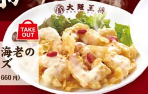
ぷりぷり海老の マヨネーズ 612円(税込660円)