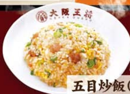
五目炒飯(小) 343円(税込370円)