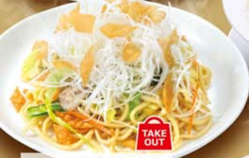
ネギ塩焼きそば 612円(税込660円)