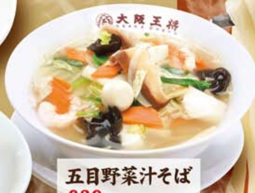
五目野菜汁そば 639円(税込690円)