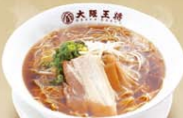
醤油ラーメン 510円(税込550円)