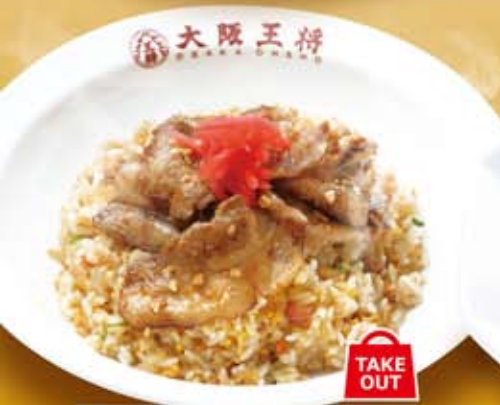
スタミナ肉やきめし TAKE OUT 639円 (税込 690円)