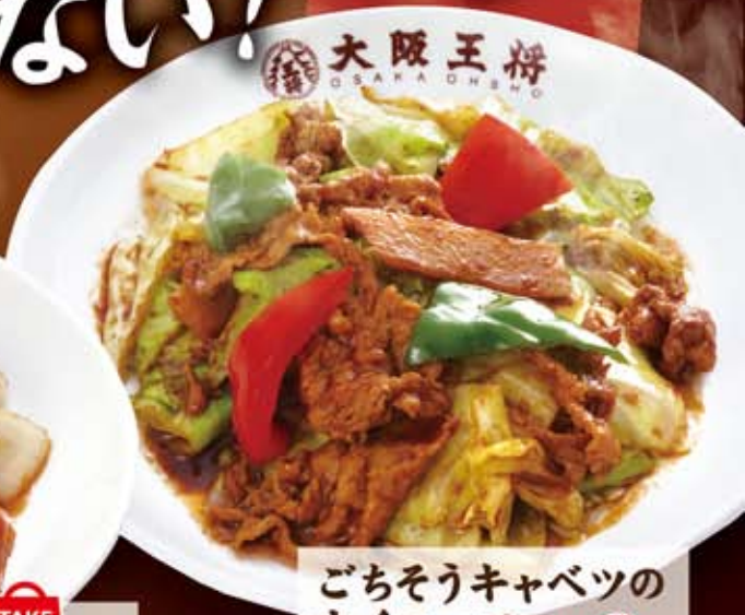
ごちそうキャベツの ホイコーロー 667円(税込720円)