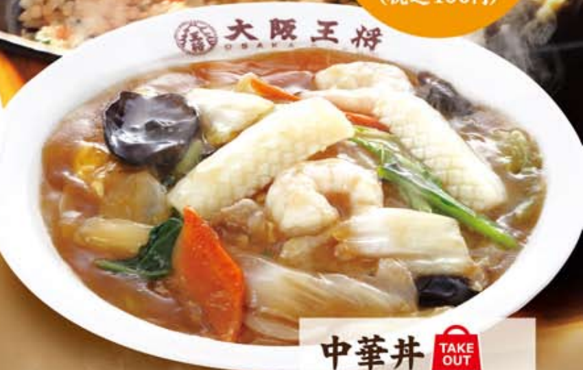
中華丼 TAKE OUT 584円 (税込 630円)