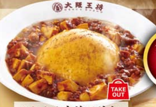
ふわとろ麻婆天津飯 TAKE OUT 584円 (税込 630円)