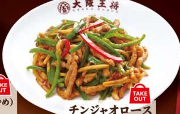
チンジャオロース 667円(税込720円)