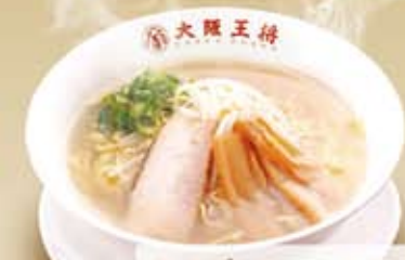
うま塩ラーメン 556円(税込600円)