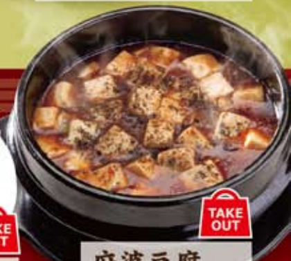
麻婆豆腐 547円(税込590円)