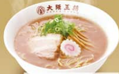
煮干醤油ラーメン 556円(税込600円)