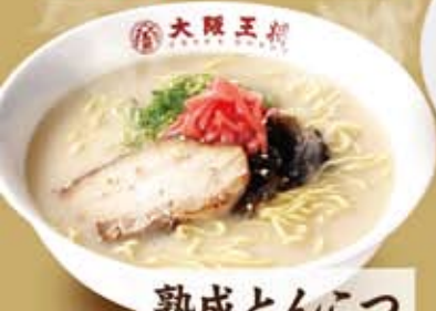
熟成とんこつ ラーメン 556円(税込600円)