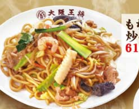
もちもち太麺の 炒め焼きそば 612円(税込660円)