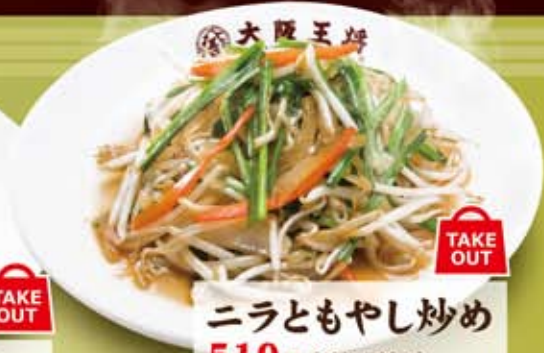
ニラともやし炒め 519円(税込560円)