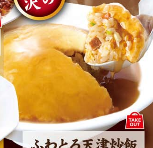
ふわとろ天津炒飯 TAKE OUT 584円 (税込 630円)