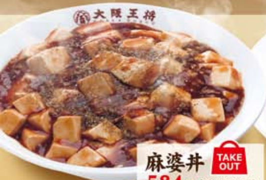
麻婆丼 TAKE OUT 584円 (税込 630円)