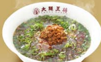
ピリ辛肉そばろ 醤油ラーメン 584円(税込630円)