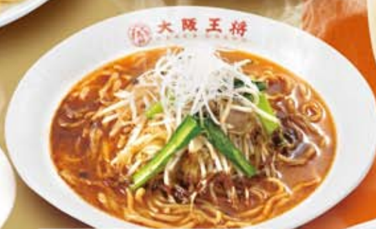
極太味噌ラーメン 723円(税込780円)