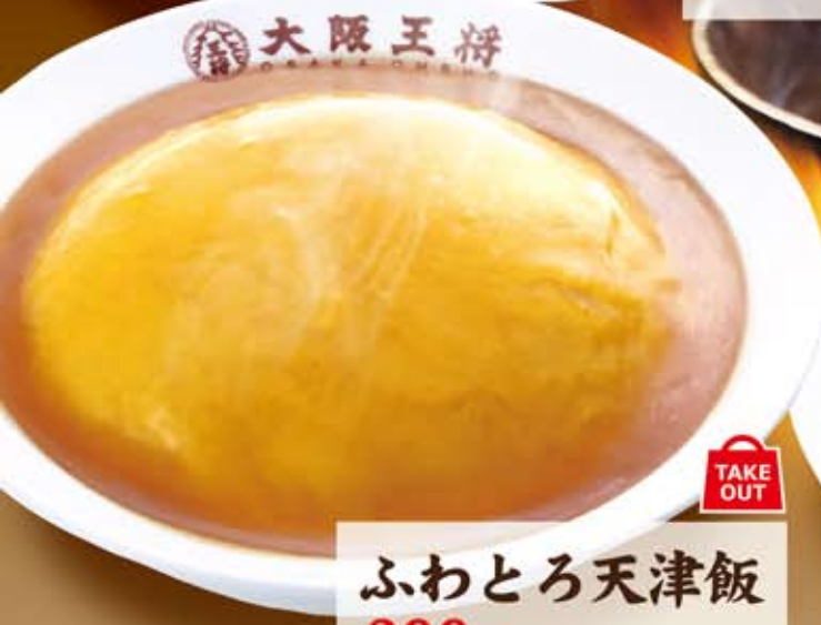
ふわとろ天津飯 TAKE OUT 399円 (税込 430円)