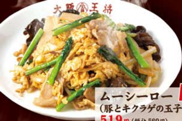
ムシーロー (豚とキクラゲの玉子炒め) 519円(税込560円)