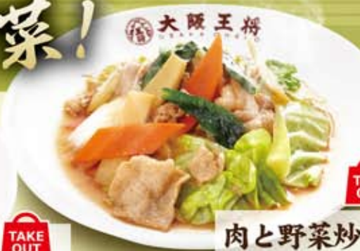
肉と野菜炒め 519円(税込560円)