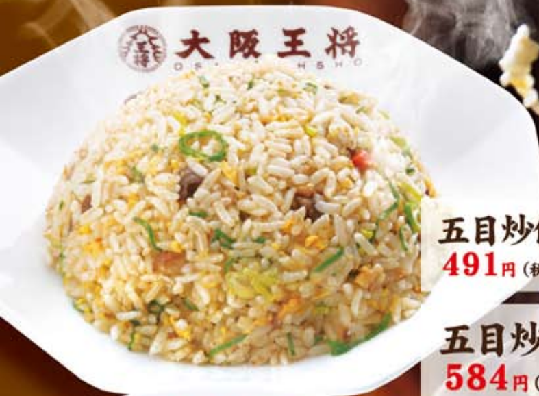
五目炒飯 TAKE OUT 491円 (税込 530円)